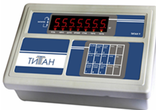
ТИТАН 9 / ТИТАН 9п