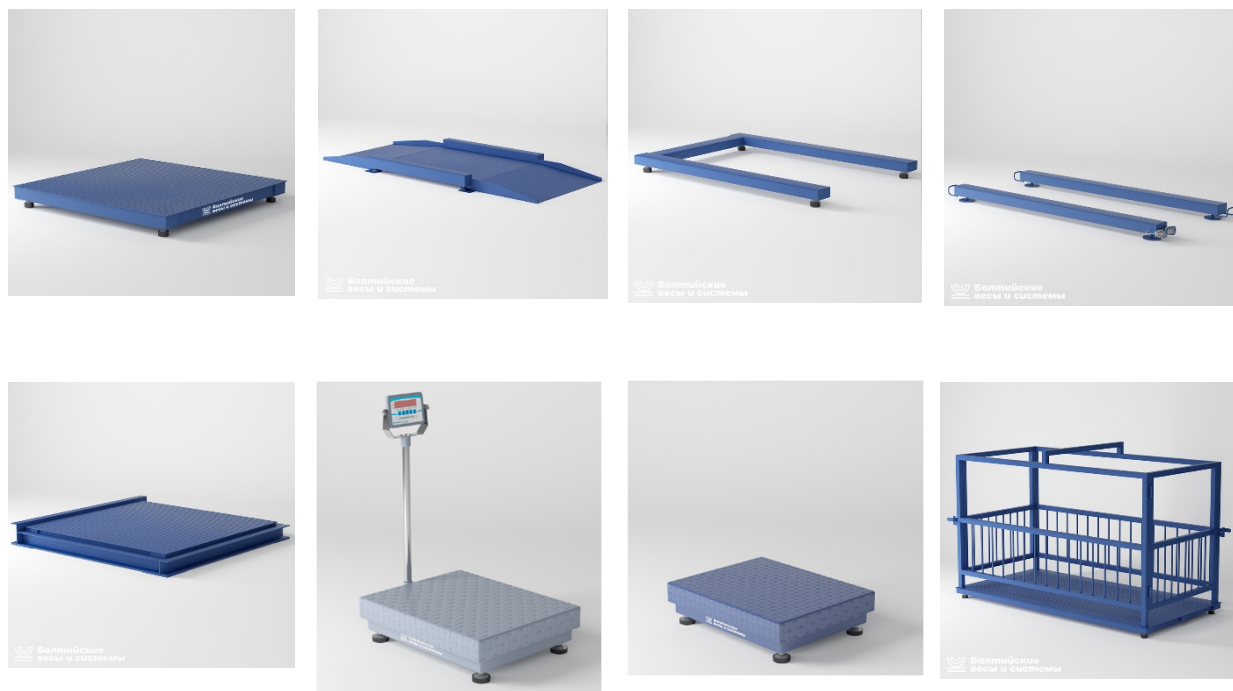
Рисунок 1 – Общий вид ГПУ весов